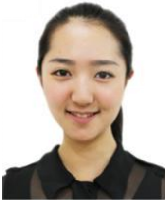
证件照标准示例照片