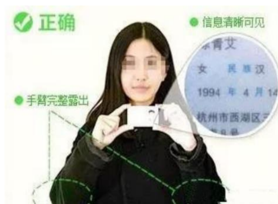
手持身份证照片示例

特别提醒：以上三项 4 个照片文件，所有考生必须上传，且必须符合上述要求，否则影响网上确认审核。